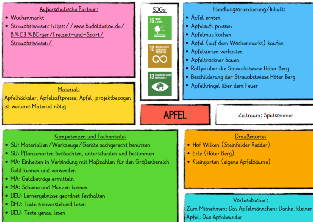
Abb: Beispielhaftes Curriculum zum Draußenlernen, hier am Thema „Apfel“