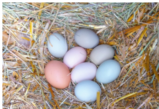
Fotos: Aufzuchtstall für Kälber und bunte Vielfalt bei den Eiern verschiedener Hühnerrassen.